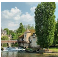
Moret-sur-Loing Musée du sucre d'orge